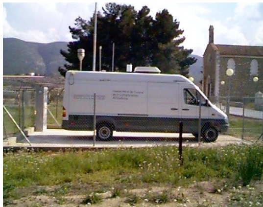
Foto: unidad Móvil de ONTINYENT

La Red Valenciana de Vigilancia y Control de la Contaminación Atmosférica cuenta con tres unidades móviles y una Unidad de Intervención Rápida, las cuales, obtienen información sobre 11 emplazamientos repartidos en el área interior de la Comunidad Valenciana