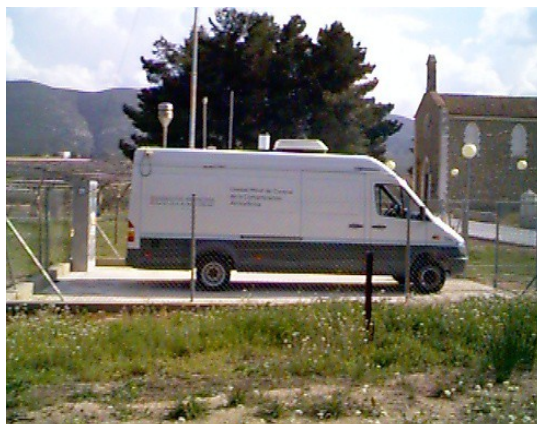
Foto: Unidad Móvil de ONTINYENT

La Red Valenciana de Vigilancia y Control de la Contaminación Atmosférica cuenta con tres unidades móviles y una Unidad de Intervención Rápida, las cuales, obtienen información sobre 11 emplazamientos repartidos en el área interior de la Comunidad Valenciana