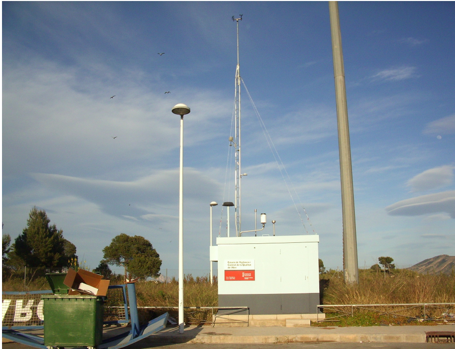
Foto: Estación de BENIDORM

También se lleva a cabo el análisis de metales como el Arsénico, Níquel, Cadmio y Plomo en la fracción PM 10 , así como del benzo(a)pireno y otros hidrocarburos aromáticos policíclicos.