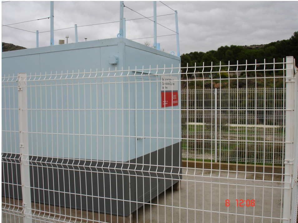
Foto: Estación de ELDA-LACY

También se lleva a cabo el análisis de metales como el Arsénico, Níquel, Cadmio y Plomo en la fracción PM 10 , así como del benzo(a)pireno y otros hidrocarburos aromáticos policíclicos.