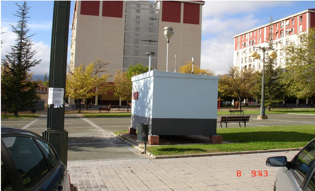
Foto: Estación de ALCOI-VERGE DELS LLIRIS

En algunas estaciones se dispone además de sensores para diferentes parámetros meteorológicos, como velocidad y dirección del viento, humedad relativa, radiación solar, presión atmosférica y precipitación. Estos parámetros son útiles para la interpretación de los datos y el conocimiento de la dinámica de los contaminantes en el seno de la atmósfera.